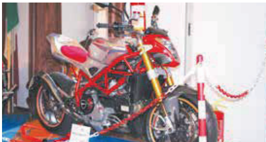
La "Belzebù" votata dalla giuria popolare

Una giuria popolare, costituita dai visitatori occasionali del motosalone, ha votato l'anno scorso questa bella cafe racer, sicuramente un bel lavoro proposto da amici appassionati che conquistano con merito la ribalta in questo spazio.