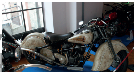
La Indian PDF, 1° premio giuria tecnica