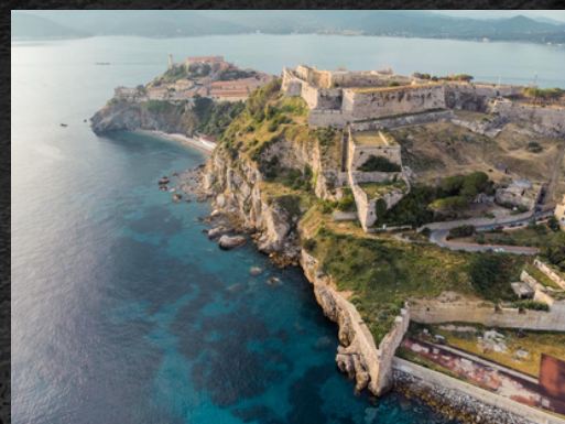
panorama CONDOMINIO LA ROCCA

Lasciando la statale 161 ci immetteremo nella Via Panoramica raggiungendo (con un breve tratto sterrato ma agevolmente percorribile) il Forte Stella dove ci sarà la seconda sosta panoramica più visita del forte al suo interno. biglietto euro da effettuare sul posto.